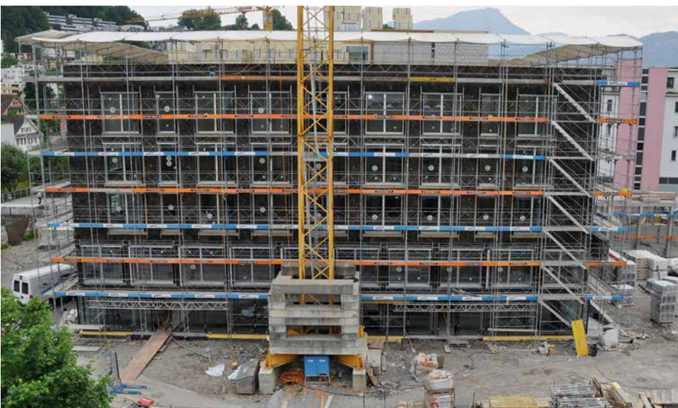
Wo früher der Musikschulpavillon stand, wird nun der neue «Kopfbau Ost» gebaut, wo neben Musikschulräumen auch die Bibliothek entsteht.