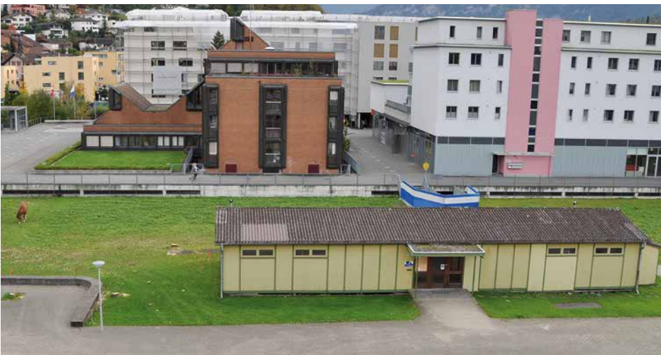
Im Oktober 2013 stand noch der Musikschulpavillon und auf der Wiese weideten Pferde; im Hintergrund das Gemeindehaus vor der Sanierung.